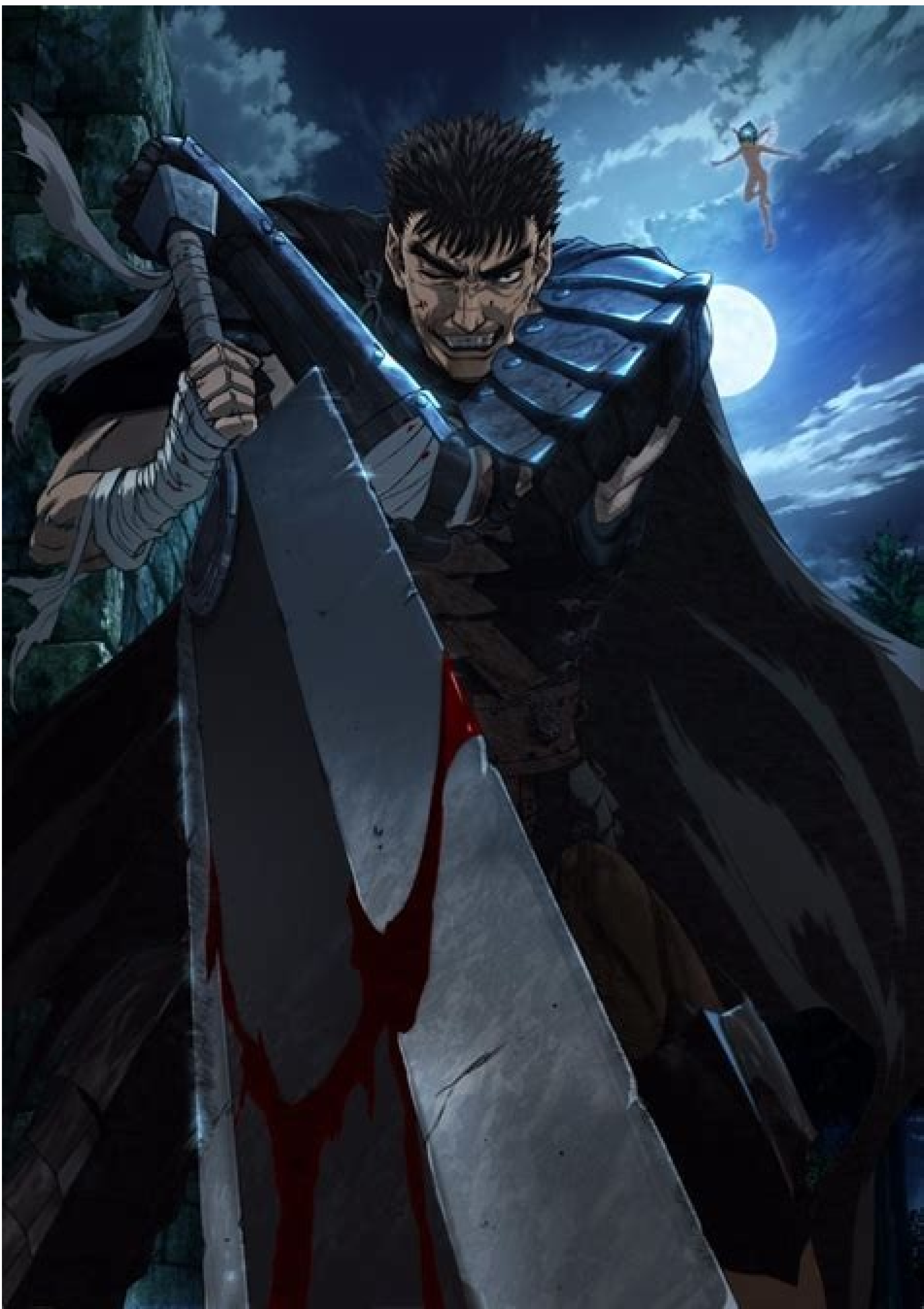
Berserk anime 2016 free download. Berserk anime 2016 free online.